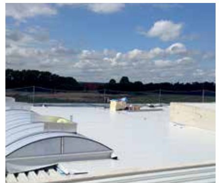
Ausführung der Dachabdichtungsarbeiten mit MAPEPLAN® M.