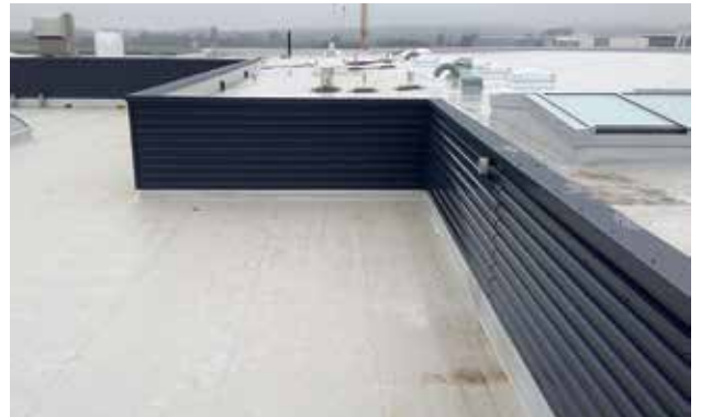
Ausführung Wandanschluss mit MAPEPLAN® M.

Als Generalunternehmen fungierte die Habau GmbH aus Heinsberg, die deutschlandweit als Marktführer im zukunftsweisenden Autohaus-Bau gilt. Den Auftrag für die Ausführung der Dach- und Wandkonstruktionen erteilte sie der Profil System GmbH & Co. KG, Bad Salzuflen. Die gute Auswahl der Baustoffe, die richtige Baukonstruktion und die solide, fachgerechte Bauausführung hatten bei der Realisierung des Porsche Modellbetriebs oberste Priorität. Für die Abdichtung der rund 4.500 m 2 Flach-