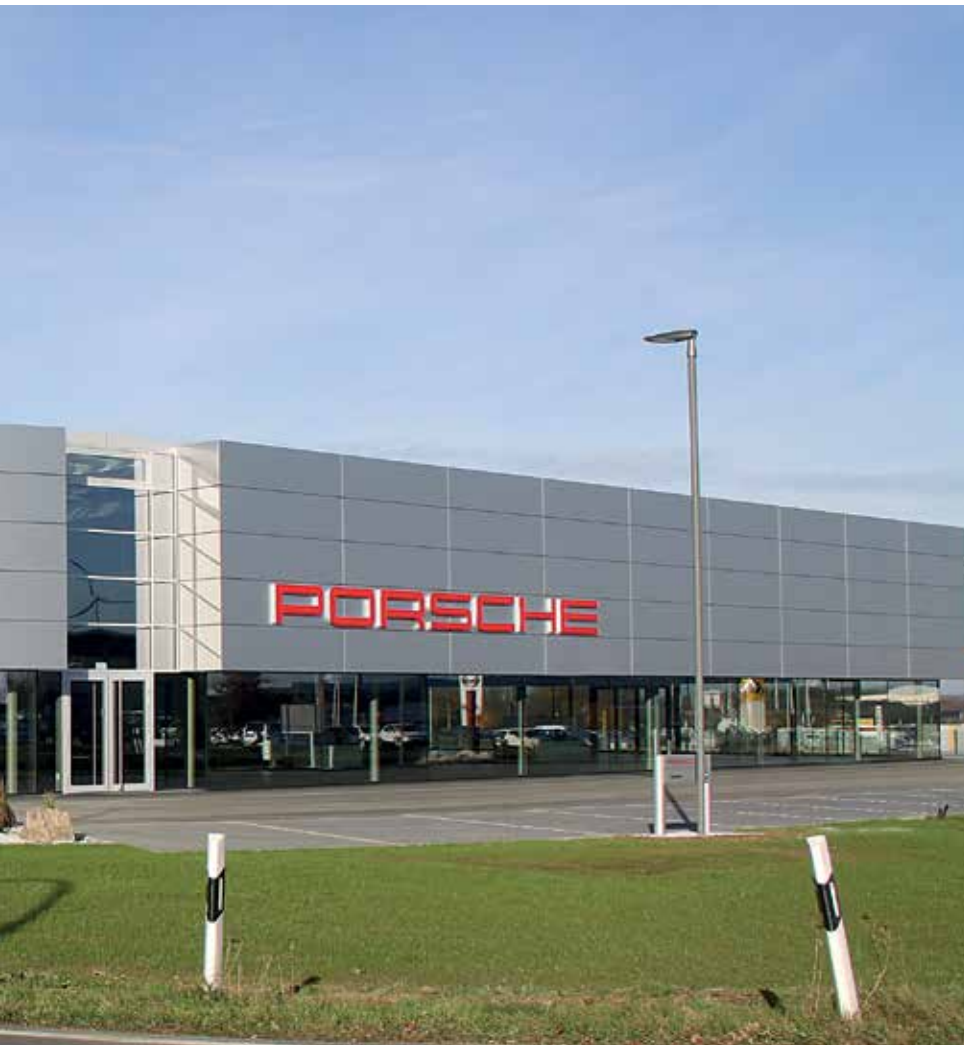
Motor-Medien Glasenapp auto sport fenster

dachfläche setzte der Spezialist für Abdichtungstechnik im Industrie- und Gewerbebau MAPEPLAN® M 15 aus der MAPEI Roofing-Sparte als sichere Lösung ein. Für das auf Dach- und Wandkonstruktionen spezialisierte Unternehmen bietet die extrudierte Kunststoffdachbahn auf Basis von hochwertigem Polyvinylchlorid mit innenliegender Verstärkung aus Polyestergerlege überzeugende spezifische Materialeigenschaften sowie eine hervorragende Verarbeitungs- und Verschweißbarkeit. Außerdem verfügt das Premiumprodukt über eine hervorragende Alterungsbeständigkeit und Widerstandsfähigkeit sowie Kälteflexibilität und UV-Beständigkeit. Bei dem Porsche Bauprojekt sicherte MAPEPLAN® M 15 im Dachbereich eine konsequente bauliche Umsetzung auf hohem Niveau bei. Die lose verlegten Dachbahnen wurden mechanisch fixiert, auf dem Untergrund verlegt, sowie materialhomogen verschweißt. Diese Verlegetechnik hat sich in den vergangenen Jahrzehnten in der Praxis bewährt.